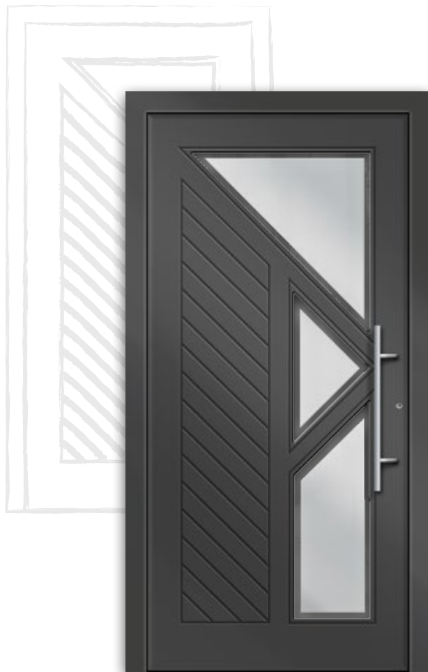
Modell RK 2100