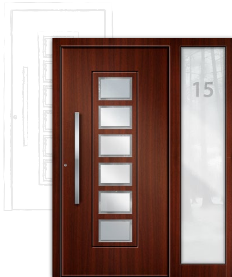
Modell RK 2200