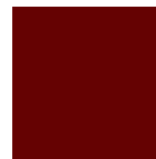
RAL 3004 Purpurrot matt oder Feinstruktur