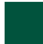
RAL 6005 Mossgrün matt oder Feinstruktur