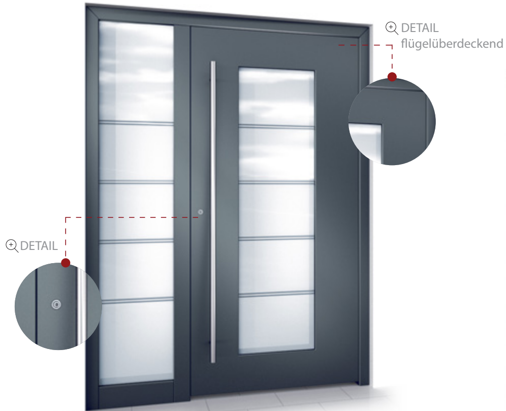
Haustür RKA 1 mit Seitenteil „Anwendungsbeispiel“