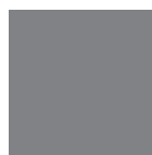
RAL 9007 Graualuminium matt oder Feinstruktur