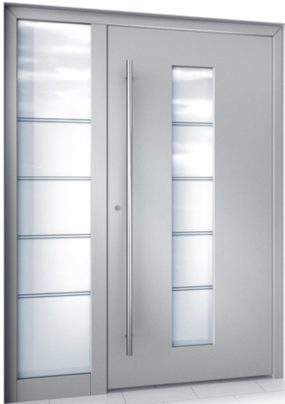
Haustür RKA 4 mit Seitenteil „Anwendungsbeispiel“