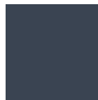
RAL 7015 Schiefergrau matt oder Feinstruktur